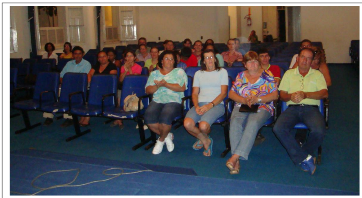
Figura 1 – Aula inaugural – 15 de março de 2010 – Casa de Cultura de São Pedro do Sul.

As aulas da turma de São Pedro do Sul, com a qual foi desenvolvida a experiência de letramento apresentada, tiveram início no dia 15 de março de 2010, na Casa de Cultura do município, conforme figura abaixo.